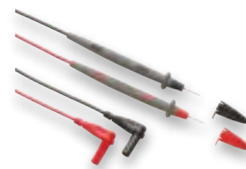
TL71-1 førsteklasses testledningssett