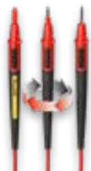
TL175E Twistguard™ testledninger (4 mm)