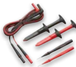
TL223-1 SureGrip™ ledningspakke for elektrotesting