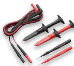
TL223-1 SureGrip™ lednings- pakke for elektrotesting