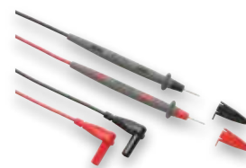
TL71-1 førsteklasses testledningssett