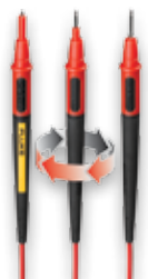
TL175E Twistguard™ testledninger (4 mm)

Visste du at Fluke har et komplett utvalg av tilbehør? Her er fire ting alle teknikere må ha: